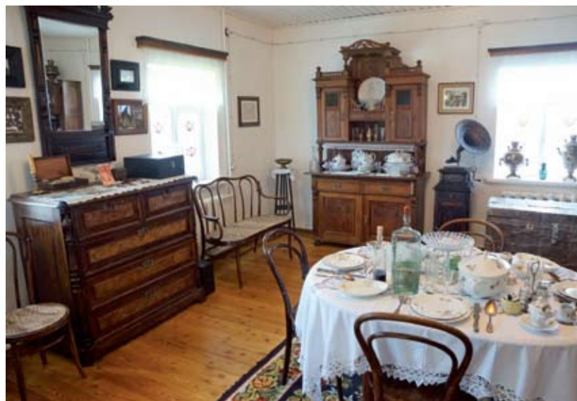
Экспозиция в музее И.С. Дзреева.