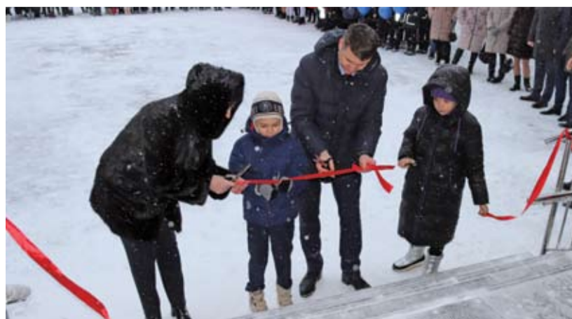
Открытие школы по улице Дачной.