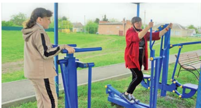
Хлебодарненцы на тренажерной площадке.