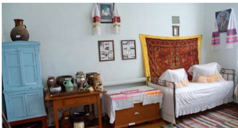
Одна из экспозиций духоборческой культуры.