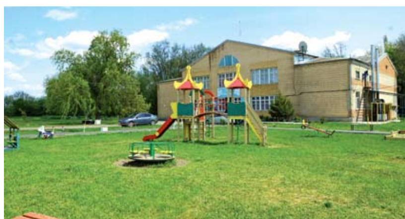
Детская площадка в селе Хлебодарном.