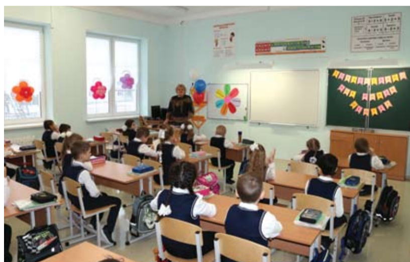
Дети в новой школе №15.