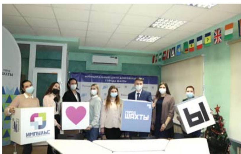
В молодежном центре.