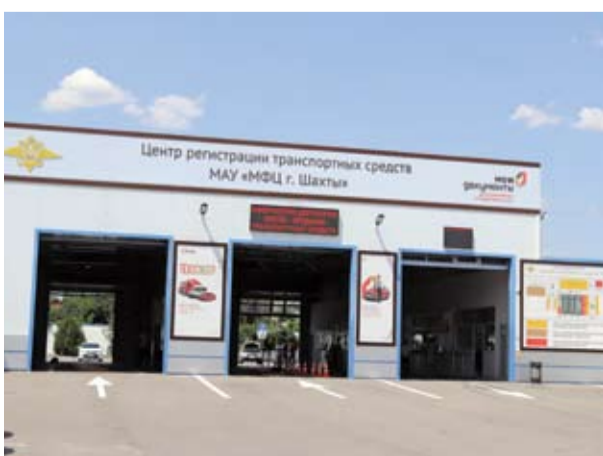
Пункт регистрации транспортных средств в МФЦ.