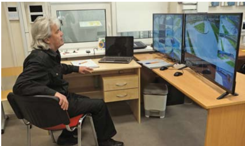
Пультовая охраны в лицее №20 Ростова-на-Дону.

Беседовал Геннадий Белоцерковский