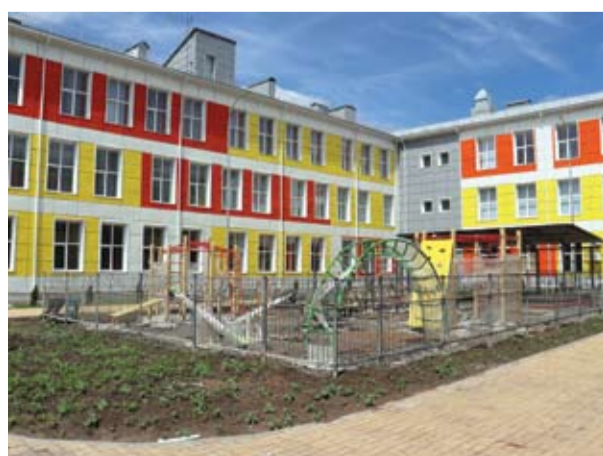
Строительство школы на 600 мест.