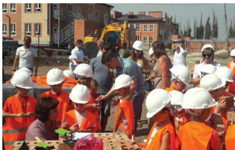
Дети посетили строительство детсада.