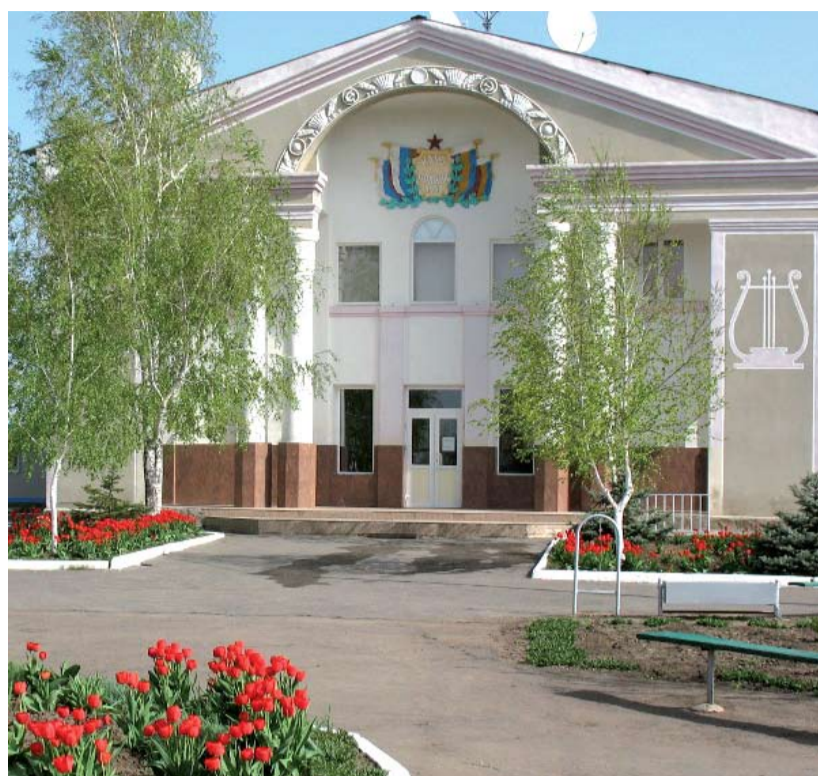
Дом культуры в станице Сладкая Балка.