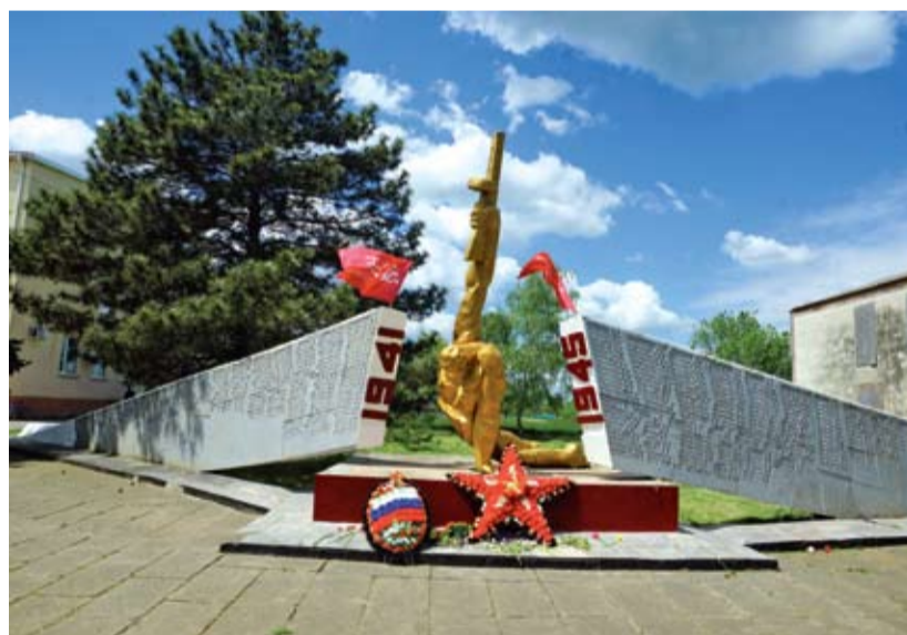
Мемориал в селе Лопанка.