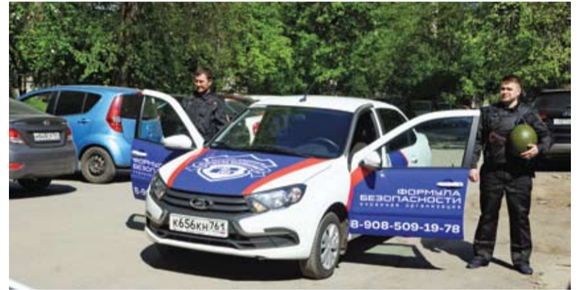
На выезде – группа быстрого реагирования «Формулы безопасности».

– Только низкой ценой контракта. Демпингом. На зарплату величиной в МРОТ соглашаются только пожилые люди. Для них это добавка к пенсии. От таких работников сложно чего-то требовать.