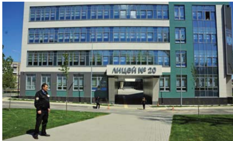
Лицей №20 Ростова-на-Дону – под надежной охраной.