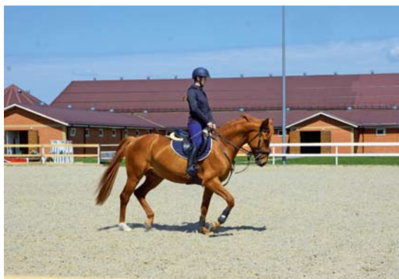
Занятия в конноспортивной школе.